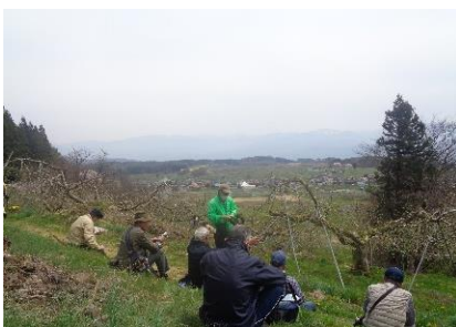
平出周辺をお散歩！

町内在住の男性を対象に月 1 回(不定期)開催しています。活動内容は参加者のやりたいこと、興味があることを中心に、とにかくゆる～く活動しています。 なにか始めてみたいな！少し活動が気になる！と感じた方はぜひ一度男笑室 だんしょうしつ に来てみませんか？お待ちしております。