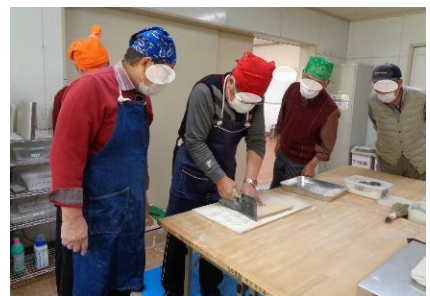
参加者が講師になりそば打ち体験をしました。