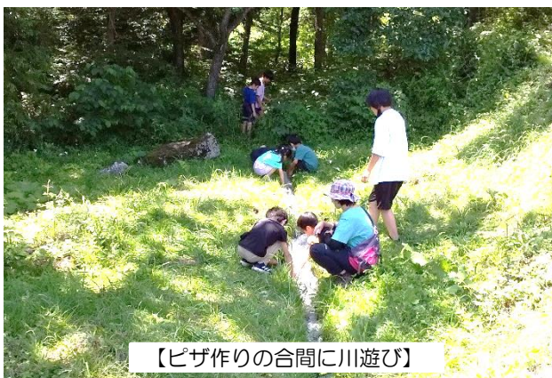
【ピザ作りの合間に川遊び】