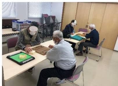
室内でゆっくり将棋もいいですね。