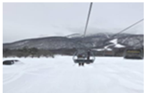
リフトからハイチーズ📷

OZ Field が子どもたちにとって居心地のよい場所で在り続けられるよう、毎日の小さな安心を積み重ねて、大きな安心に繋がるよう活動していきたいと思っています。