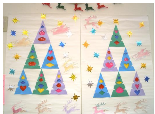
↑クリスマスには、ご利用者が作った素敵な飾りがセンターを彩りました。

しかし、センター内で出来ることに焦点をあて、ご利用者様によりよい暮らしをしていただけるよう努めております。以前こちらでも紹介させていただきましたが、手洗い・うがいを2回行うことで成果が大きく違うようなので、ご自宅でも実施してみてください。