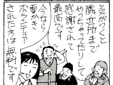
※この物語はフィクションです