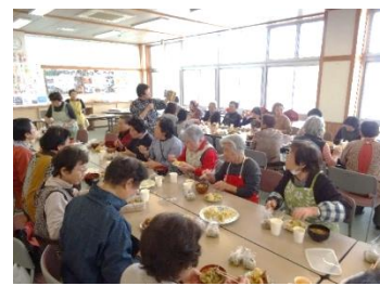
各団体が活動を紹介します