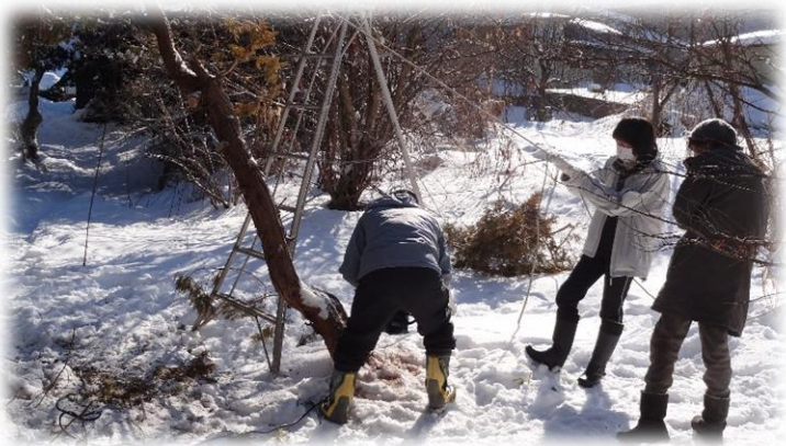
▶有償たすけあいサービスの実施風景 (家屋に持たれかかった木の伐採)