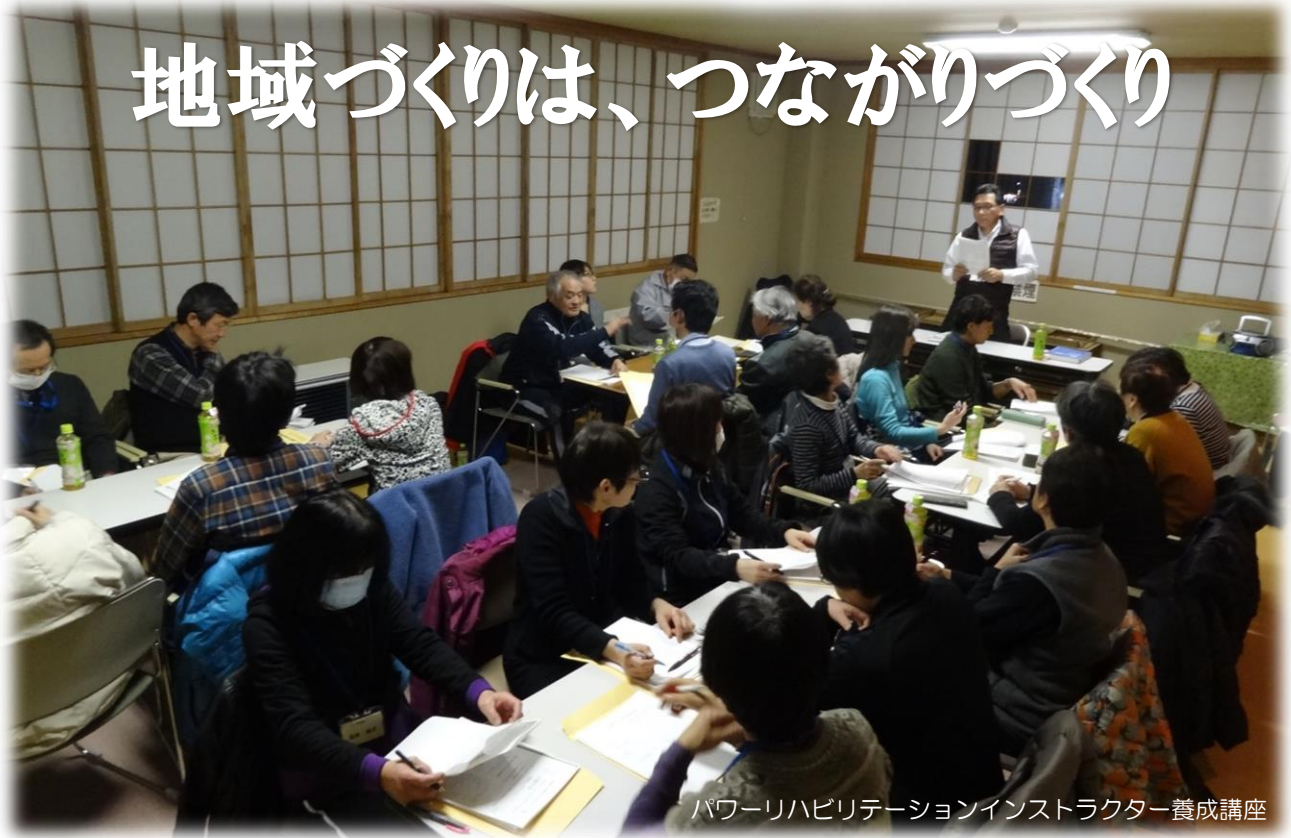
パワーリハビリテーションインストラクター養成講座