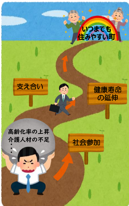
生活支援体制整備事業イメージ

飯綱町社会福祉協議会では、町より新しい総合事業における「生活支援体制整備事業」を委託し、平成29年度2名の生活支援コーディネーターが配置されています。 生活支援体制整備事業は、介護保険法に位置付けられており、高齢者が住み慣れた地域で生きがいを持ちながら生活していくために、生活上の困りごとを解決する仕組みづくり(生活支援、高齢者自身が主体的に健康の増進・維持に取り組む仕組みづくり(介護予防)を老人クラブや自治会、ボランティア団体など多様な主体の参画により整備するものです。