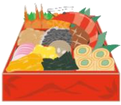
愛ちゃんと希望くん